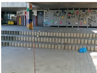
Müll auf dem Schulhof

Nachdem wir letzte Woche einen solch positiven Artikel zur Remsputzede veröffentlichen konnten, nun wieder verstörende Nachrichten. Am Wochenende, zwischen dem 18./19. März wurde auf dem Schulhof der Lehenbachschule extrem gewütet. Leere Pizzaschachteln, Plastikbecher und haufenweise Scherben waren auf dem gesamten Schulhof verteilt. Vor allem die Scherben sind sehr gefährlich, denn die kleinen Splitter alle aufzusammeln, bevor die erste große Pause am Montag startet ist nahezu unmöglich. Auf dem gesamten Gelände sind mehrere Abfalleimer verteilt, die aber geflissentlich ignoriert werden. Zudem wurden die gelben Tonnen vor dem Pavillon so beschädigt, dass die Deckel kaputt sind und deren Inhalt ebenfalls überall verteilt war. Dies ist nicht zum ersten Mal passiert. Die gesamte Schulgemeinschaft der Lehenbachschule bittet nun die Verursacher noch einmal eindringlich, solche Ausschweifungen zu unterlassen. Zudem ergeht eine Bitte an die Anwohner zu melden, wenn Ihnen am Wochenende Lärm auffällt. Alle Schülerinnen und Schüler, die Lehrkräfte und Mitarbeiter so-